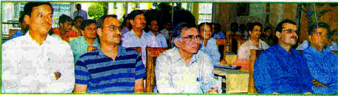
Audience was left unmoved for 4 hours during the workshop.